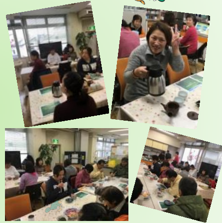
お忙しいところご協力いただきました関係者のみなさん、ありがとうございました。